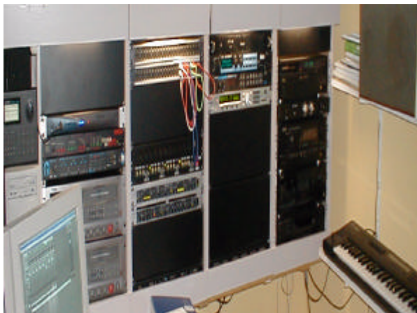
de Eventide Eclipse in actie

Deze nieuwste ontwikkeling van Eventide is de opvolger van de H3000. Het apparaat heeft de processing power van 5 H3000's en is uitgebreid met verschillende nieuwe algoritmes. Naast het bekende Harmonizer effect zijn ook goede andere effecten zoals phasers, galmen, compressie etc. met dit apparaat te maken. De voornaamste reden voor de aanschaf is dat de Eclipse een enorme meerwaarde met zich meebrengt die je alleen in de high-end studio's zult vinden. Bovendien zijn we waarschijnlijk een van de eersten, zoniet de eerste studio in Nederland die is uitgerust met dit stukje kwaliteitsgereedschap.